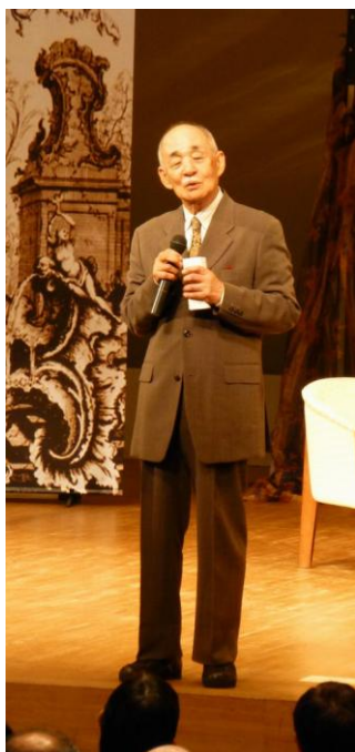
オペラ「奥様女中」について解説をしてくださった神津先生 (左)